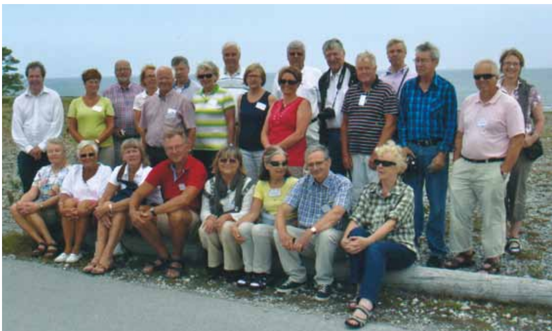
Gruppen samlad vid Helgemanness fiskeläge på Fårö.