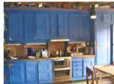
Interiör från köket.