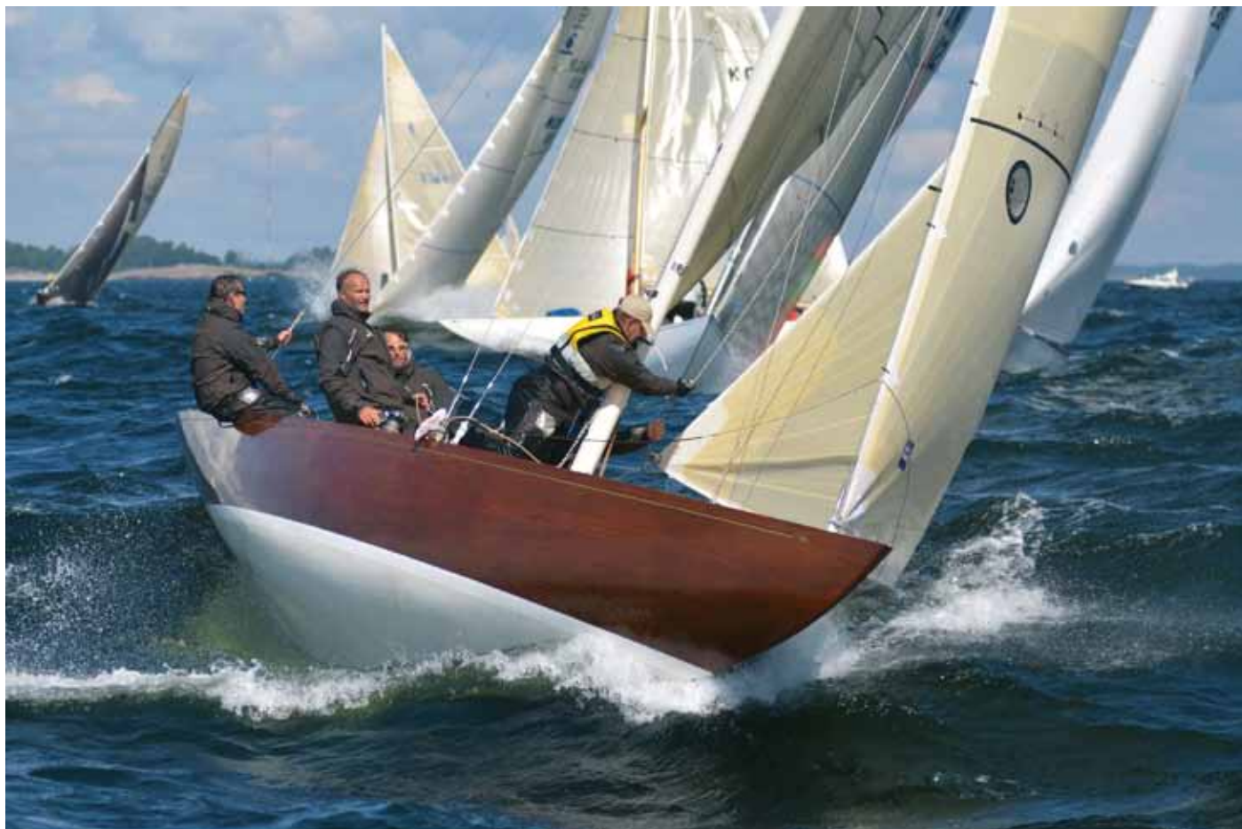
De klassiska sexorna figurerade i huvudrollerna i årets tävlingskalender

var den första segelföreningen och idrottsamfundet i Finland överhuvudtaget att uppnå denna status.