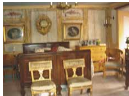
Den pompösa sängkammaren.