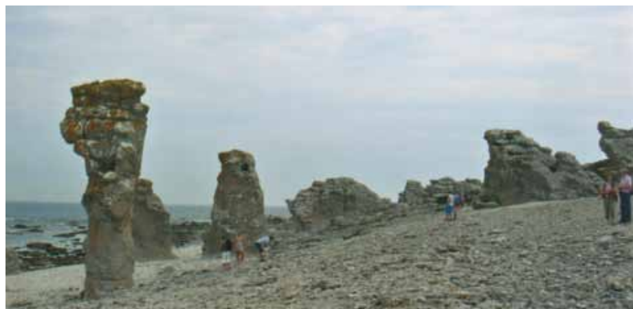
Fåröns typiska, av naturen skapade, raukar. Rauk betyder på gutamål pelare.