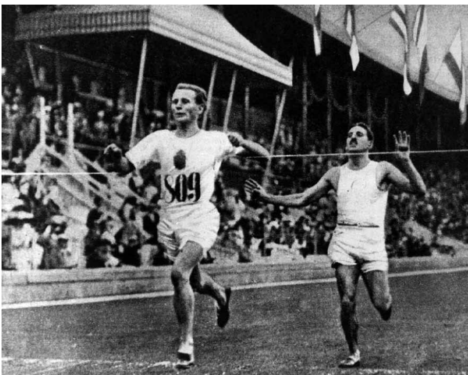
Hannes Kolehmainen löpte Finland in på världskartan i OS 1912 i Stockholm Här vinner han 5 000 meter före fransmannen Jen Bouin. Ännu 30 meter före målet var han några steg bakom fransmannen.

Det är bevisligen möjligt för Finland att