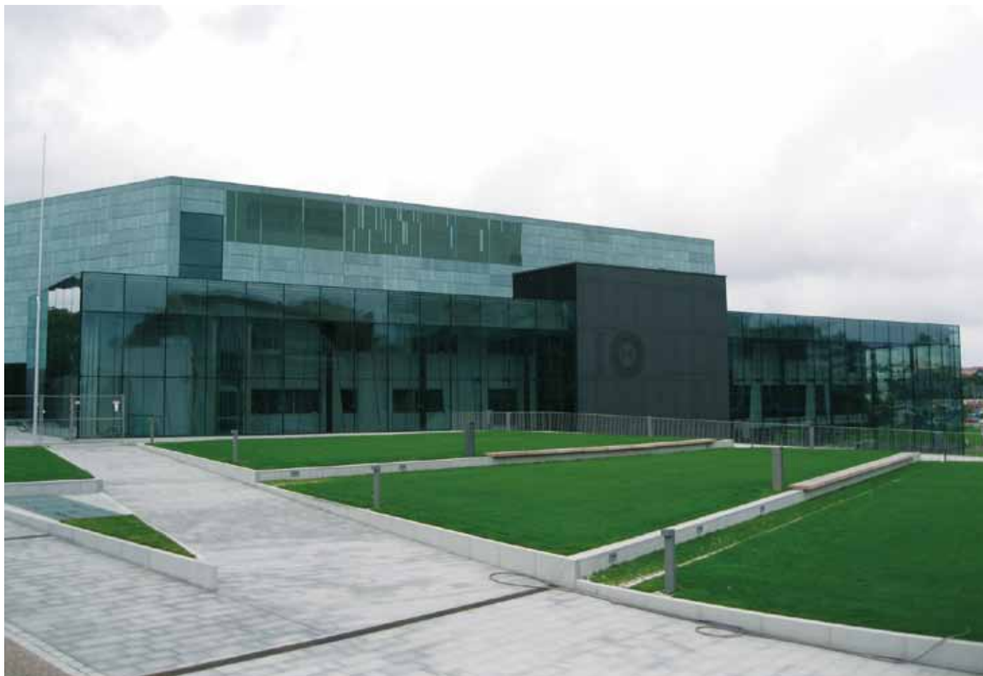
Storprojektet Musikhusets byggnadskostnader 166 miljoner euro har i främsta hand finansierats med offentliga medel. Stiftelser och fonder samt Sibelius Akademi har bidragit med 5 miljoner av inredningens kostnad på 23 miljoner euro.

den offentliga sektorn. Den huvudsakliga kostnaden är räntan. Ofta måste en PPP för sin finansiering betala en högre och t.o.m. en mycket högre ränta än den offentliga sektorn. Detta gäller i synnerhet medlemsländer med svag kreditvärdighet. Finansiering av offentliga projekt med en PPP-metod borde därför inte vara särskilt lockande i dagens läge för Finland eller Sverige. Däremot borde finansieringsformen vara lockande för u-länder och ekonomiskt svaga länder inom EU.