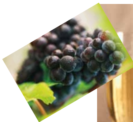
Pinot Noir vindruvor som användes vid framställningen av champagnen Dom Pérignon. Här invid en flaska från årgång 1992.

Men när det sker en andra jäsning inne i flaskan bildas det mycket fällning, vilket ju är oönskat. Den biten klarade han inte av att lösa, utan det gjorde Madame Veuve Clicquot Ponsardin långt senare. Hon låg vaken en natt och funderade på