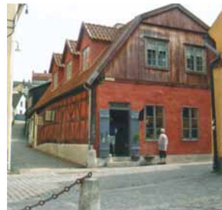
Ett av de många charmiga frähusen i Visby.