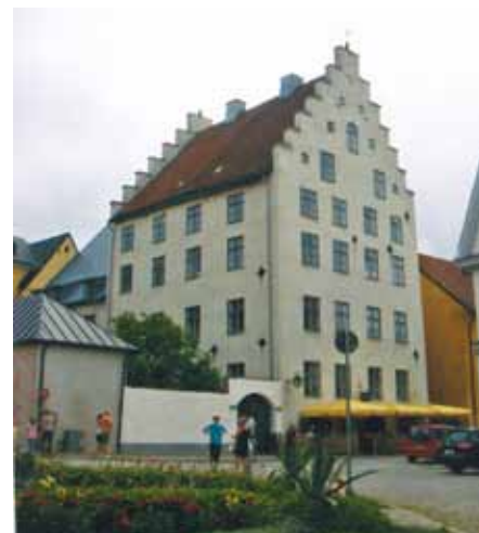
Köpmannahuset i Visby från 1500-talet i den ovanliga trappgavelstilen.