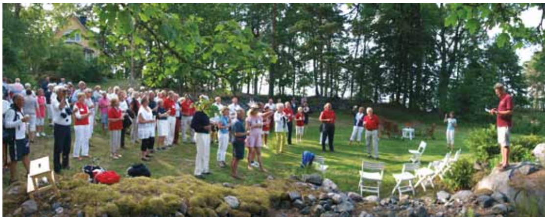
Den sociala sidan är minst lika viktig som seglingen i NJK:s verksamhet.

Segelföreningen i Björneborg inlämnade sina stadgar för godkännande till Kejsaren år 1856, men fick sina stadgar godkända först år 1867.