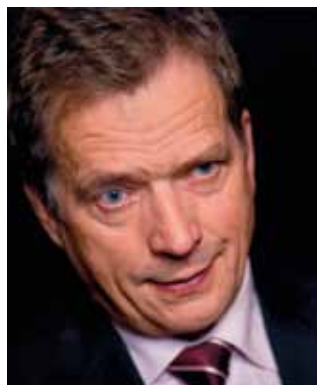
Sauli Niinistö såg inte Ryssland som något hot utan som en ekonomisk möjlighet

Alla kandidater var ense om att presidentens viktigaste uppgift är att leda Finlands utrikes- och säkerhetspolitik i samråd med statsrådet samt att verka som överbefälhavare för försvarsmakten. Presidenten uppfattas som