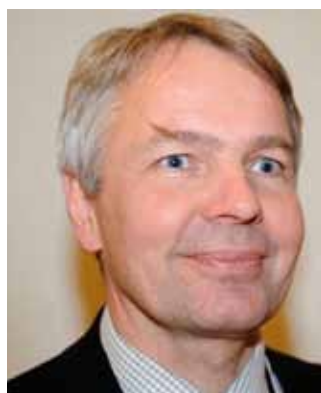
Paavo Haavisto spådde en omstrukturering av Europa och att Finland får nya "gudfäder" som styr och ställer hos oss

Alla kandidater såg Ryssland som en viktig ekonomisk handelspartner med en