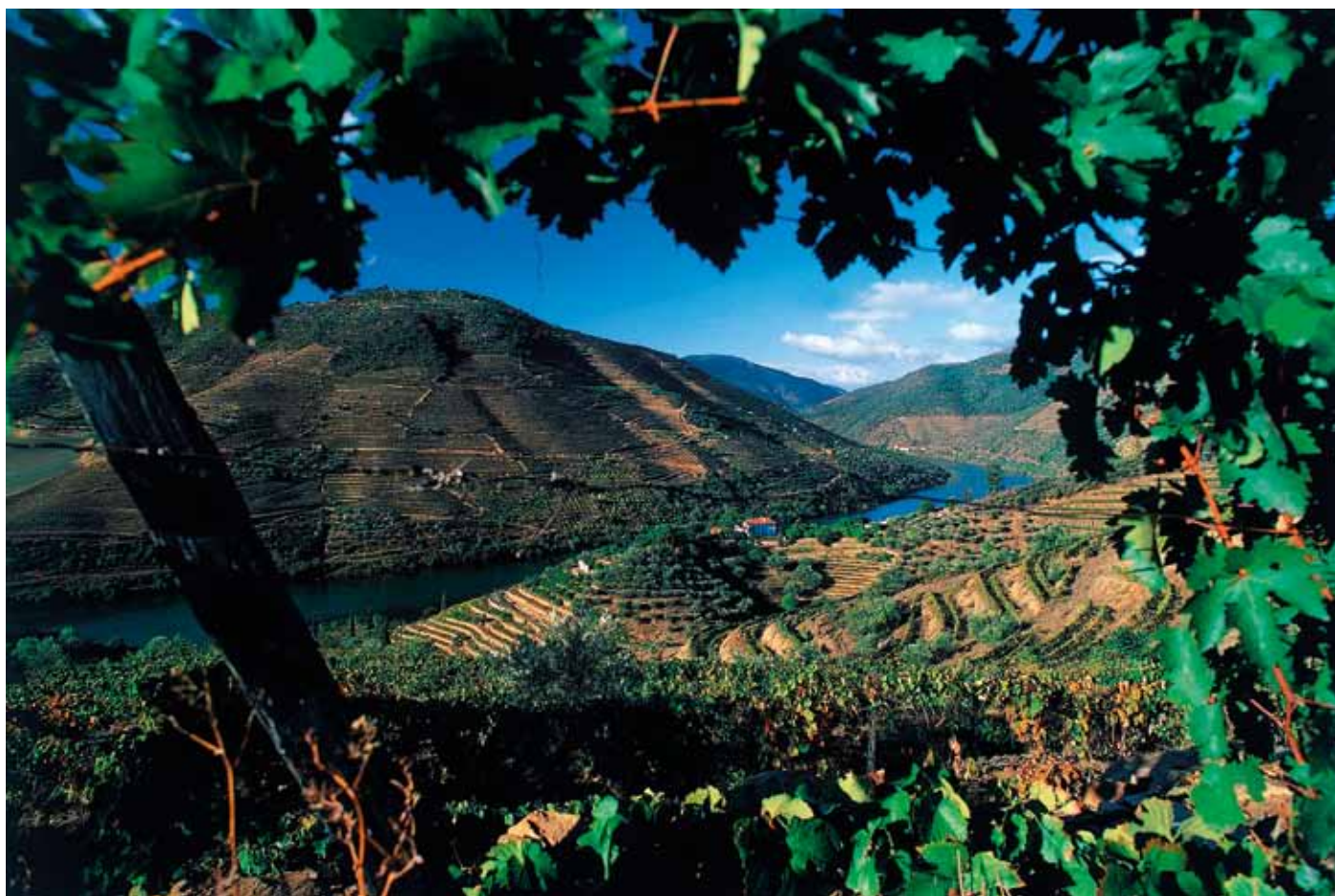
Stämningfull bild över Grahams odlingar längs sluttningarna vid övre delen av floden Douro

glädje. En gång hade vinet inte jäst färdigt när det uppsprutades kring år 1775, så det var lite sött. På det sättet uppstod portvinet, men det dröjde till ca år 1850 innan portvinet gjordes enligt föreskrivna normer.