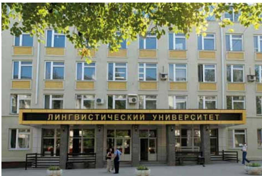
Nizjnij Novgorods lingvistiska universitet där jag studerade.