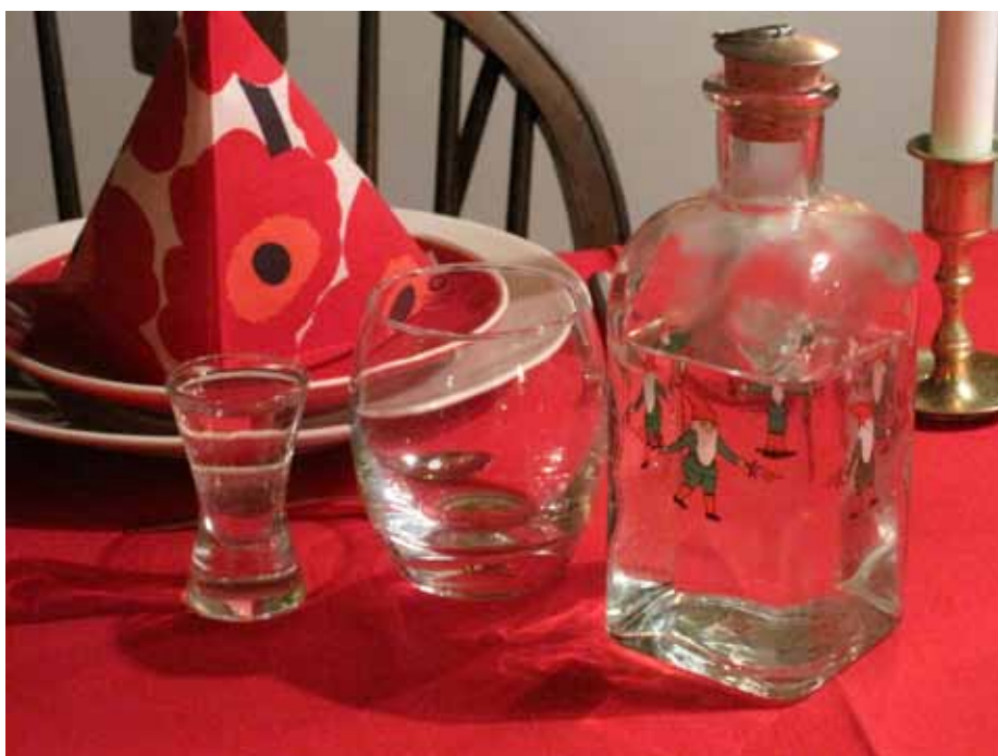
Trots att julsnapsen är en tradition i många hem finns det få snapsvisor med jultema.

Dessutom användes det i kruttillverkning. I båda fallen omfattades tillverkningen av stränga restriktioner och det dröjde ända till 1600-talet innan allmogen lärde sig att destillera brännvin. Då började man också använda säd som råvara i stället för det dyrbara vinet, men det dröjde ännu ett par århundraden