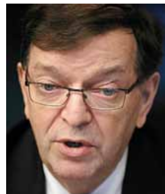
Paavo Väryrynen uppfattar EU som ett hot mot fortlevnaden av den nordiska välfärdsmodellen.

Lipponen såg dessutom en roll för presidenten också i EU-sammanhang, t ex vid