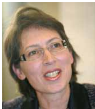
Sari Essayah lyfte fram EU:s utveckling mot en överstatlig federation. som ett hot.

Våra nationella svagheter räknades också upp, bl a vårt geografiska läge, vår nationella litenhet, rasism och självcentrering. Inga lösningar på hur dessa svagheter kunde övervinnas diskuterades.