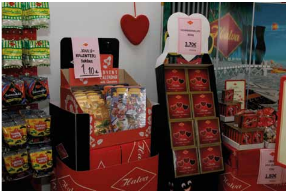
Säsongsprodukter. Halva importerar choklad, speciellt till julen.

– Panda har exporterat sedan 1970-talet och har därmed ett visst försprång. Å andra sidan har Panda banat väg också för oss i och med att finländsk lakrits